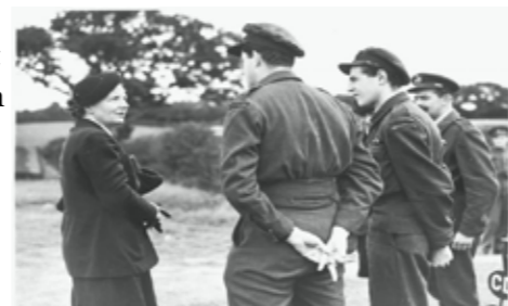
In gesprek met militairen