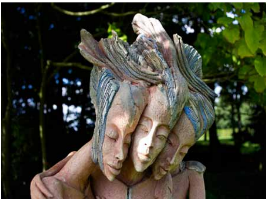
zomer 2012 - Christien Dutoit - Terracotta werk