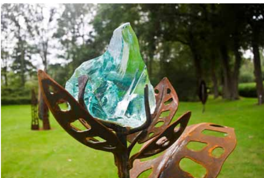
zomer 2020 - Henk Slomp - Cortenstaal en glas