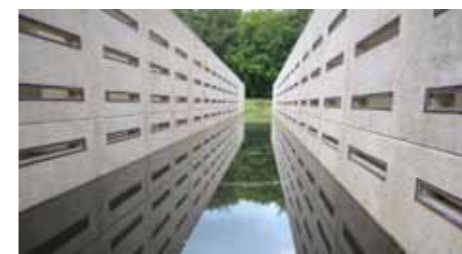
onder en boven: de deltagoot

loopkundig Laboratorium' zich op deze plek. Dit is de periode vlak na de WO-II toen de wederopbouw van Nederland startte met o.a. de aanleg van grote waterwerken. In 1996 verhuisden de ingenieurs terug naar Delft, de tijd van de grote waterwerken was voorbij en, nog belangrijker, veldwerk werd computerwerk. Het terrein lag er enige tijd vrijwel onbeheerd bij en raakte overwoekerd tot het in beheer kwam bij Natuurmonumenten in 2002 en een herstelprogramma werd gestart.