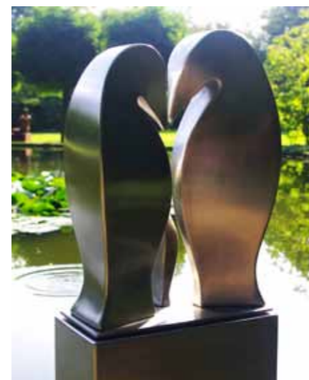
zomer 2016 - Lolke van der Bij - r.v. staal

Bij de ondertiteling treft u het expositiejaar , de kunstenaar en het gebruikte materiaal aan.