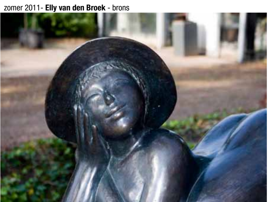
zomer 2011 - Elly van den Broek - brons

genoemd, verder uit met een galerie en een brasserie. Inmiddels trekt het park jaarlijks rond de 20.000 bezoekers.