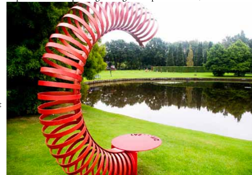
Alles is gebaseerd op de cirkel...