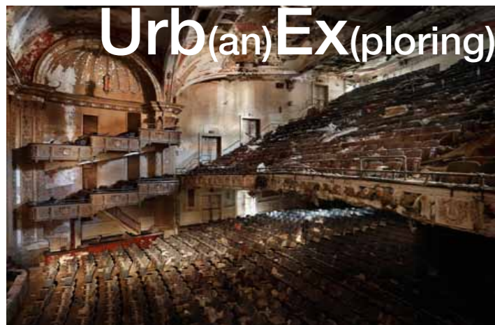
Adams Theatre, New Jersey

'Take nothing but photographs, leave nothing but footprints' Door Ellen Vorsteveld