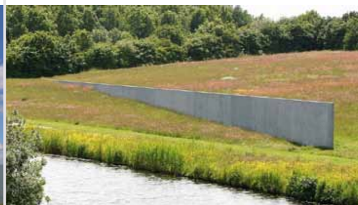
Sea Level (1996) van Richard Serra. De twee betonnen muren van Sea Level zijn elk tweehonderd meter lang en staan diagonaal in elkaars verlengde aan weerszijde van een kanaal als een waterpas in het landschapspark de Wetering. Ze geven op die manier fysieke betekenis aan het begrip zeeniveau.