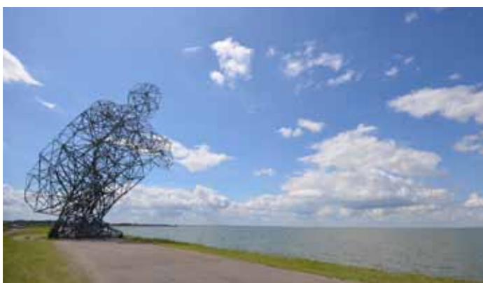
Exposure (2010) van Anthony Gormley, ook wel de hurkende man genoemd. Een beeld van 26 meter hoog, bestaande uit 1800 staven metaal. Op de strekdam bij Lelystad kijkt hij uit over het Markermeer en balanceert op de grens van land en water.