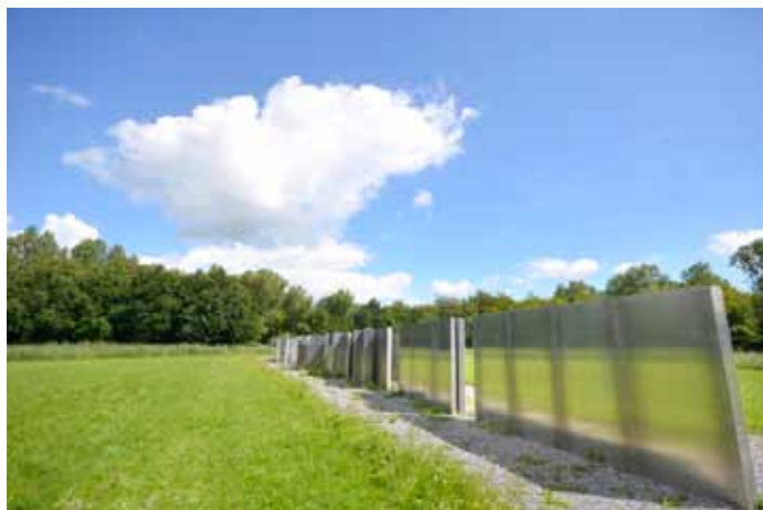
Polderland garden of love and fire (1997) van Daniel Libeskind. Vijf elkaar kruisende lijnen verbinden mensen in andere plaatsen en tijden met elkaar. Drie smalle kanalen, een voetpad en een strook zwart grind met daarop een sculptuur van aluminium wanden.