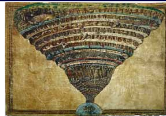
Kaart van de hel, tussen 1480 en 1490

De Louteringsberg bevindt zich midden in het zuidelijk halfrond, recht tegenover Jeruzalem, en is gevormd uit de aarde die omhoogkwam bij het vormen van de hel. De Louteringsberg is opgebouwd uit zeven lagen die overeenkomen met de zeven hoofdzonden: trots en hoogmoed, jaloezie en afgunst, woede, luiheid, hebzucht, gulzigheid en het ongebreideld verlangen en wellust. In tegenstelling tot de hel is de sfeer er aangenaam. De natuur is prachtig met veel groen en bloemen. Op de top van de Louteringsberg bevindt zich het aards paradijs, waaruit ooit Adam en Eva werden verdreven. Voordat Dante de Louteringsberg gaat verlaten moet hij, tot zijn droefheid afscheid nemen van