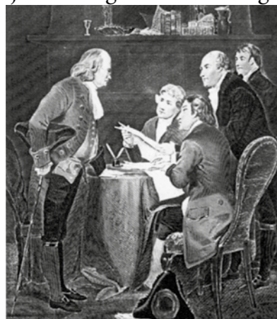
Opstellen van de onafhankelijkheidsverklaring

Het boek geeft een fraai inzicht van de eerste reis van Columbus naar Amerika, tot en met het presidentschap van Donald Trump. De rol van de sociale media, de ontwikkeling van de natie, de interne verhoudingen