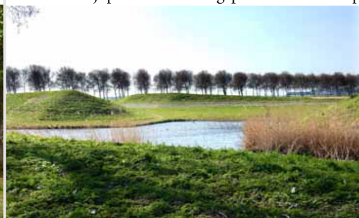
Aardzee (1982) van de in 2016 overleden Piet Slegers. Aardzee is een van de grootste kunstwerken van Nederland, vijf hectare groot. Een glooiend landschap, net als de golven in de zee met ertussen door allerlei paadjes, die bedekt zijn met blauwgrijze schelpen, een verwijzing naar lucht en water. Een oase in het open vlakke polderlandschap.