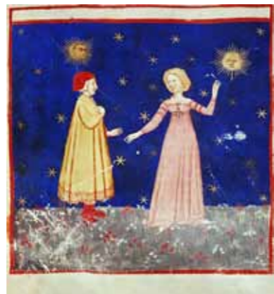
Dante en Beatrice

La Divina Commedia is een gedicht in drie delen over een reis door het hiernamaals, van de Hel (Inferno), door het Vagevuur (Purgatorio) naar het Paradijs (Paradiso). Het gedicht wordt beschouwd als een van de hoogtepunten uit de wereldliteratuur. Het werk is vele malen uitgegeven en heeft ook inspiratie gegeven aan beeldend kunstenaars waaronder