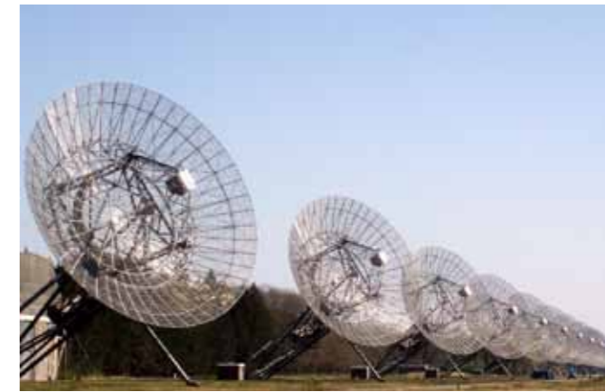
Sterrenwacht te Westerbork

de nog jonge ruimtevaart. In Florence bezoekt hij een museum dat in twee weckflessen met sterk water drie vingers van Galileo bewaart. 'In de ene drijft zijn middelvinger opgericht tegen elke vorm van gezag die zich beroept op dogma's.' (Pas in 1992 erkent paus Johannes Paulus II dat Galileo gelijk had). Door de snelle wisseling van locatie, onderwerp en tijdsgewricht krijg je als lezer soms het gevoel van enige afstand, van bovenaf, mee te kijken, een sensatie die zeer goed past bij het onderwerp van dit boek.