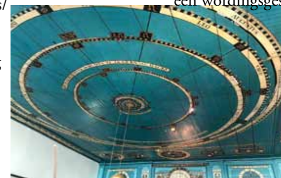
Planetarium te Franeker

Hij heeft een dystopische kijk op het leven op aarde en een pessimistische kijk op de kosmos en op de menselijke pogingen deze te bevolken. Zoals in zijn vorige boeken is hij ook in dit boek weer een meesterlijk duider van de wereld, en daarmee zijn onderwerp, aan de hand van voorwerpen, locaties en ontmoetingen. We reizen met hem, weliswaar niet in een rechte lijn, door de ontwikkelingsgeschiedenis van de astronomie en