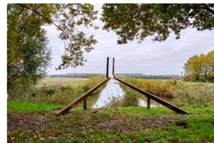
De laatste aanwinst in de polder is geplaatst in september 2020. Cityscape follows Manscape van Lieke Frielink. De lange zichtlijnen richting de dijk vragen aandacht voor de vraag "Hoe hebben mensen het nieuwe landschap vormgegeven. "De Sculptuur bewaakt een zichtlijn en vertelt zo het verhaal van dit jonge tekentafellandschap met de dijk als haar lijfwacht".