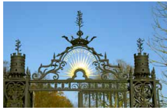
Het barokke Toegangshek van Doornburgh

Het imposante barokke toegangshek, geplaatst in 1725, is de entree tot het prachtige buiten - een buitenplaats met allure - en tot de Engelse negen hectare grote landschapstuin, die is aangelegd door de tuinarchitect J.D. Zocher. De gratis toegankelijke tuin met waterpartijen en oude bomen herbergt een grote collectie stinzenplanten.