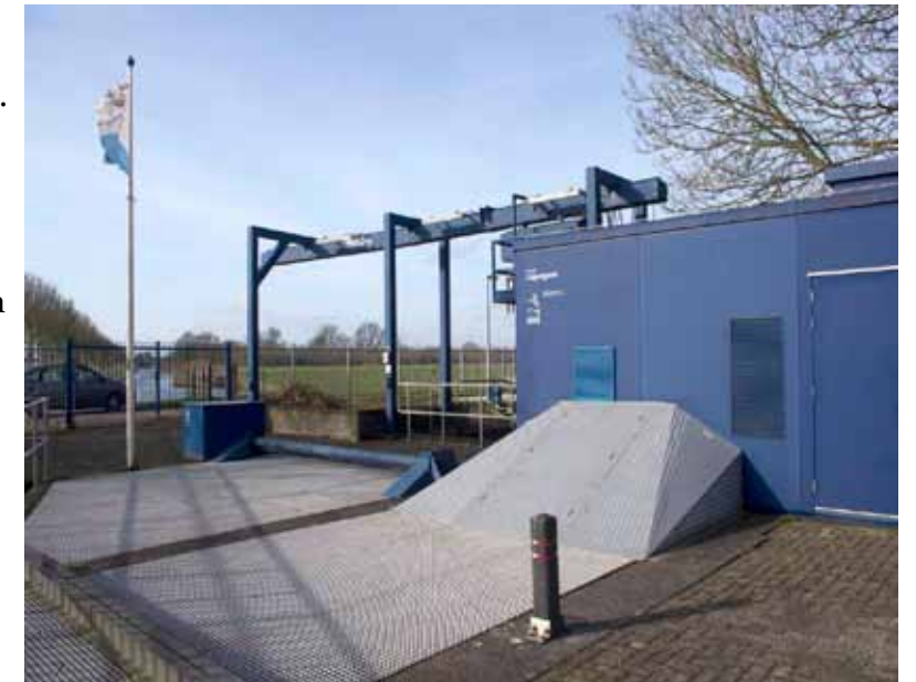
Gemaal Caspargouw bij het Amsterdam Rijnkanaal

Om dit op te lossen werd gekozen voor de bouw van gemaal Caspargouw (in 1972 en in 2006 geheel gerenoveerd) langs het ARK. Het gemaal springt bij om te voorkomen dat het waterpeil in de Kromme Rijn - en daarmee het peil in de stadsgrachten van Utrecht - te laag wordt. En uiteraard ook om de andere functies van de Kromme Rijn te realiseren. Via een in 1972 nieuw gegraven watergang, de Caspargouwse Wetering, wordt het water vervolgens ingelaten in een oude meander van de Kromme Rijn. Gemaal Caspargouw is een vijzelgemaal met een capaciteit: 180 m 3 /min. Het gemaal kan via een beweegbare stuw ook dienen als uitlaatklep om onder vrij verval het eventueel te veel aan water af te voeren.