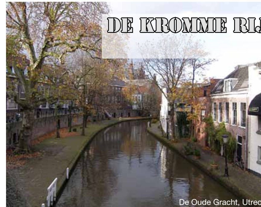
De Oude Gracht, Utrecht