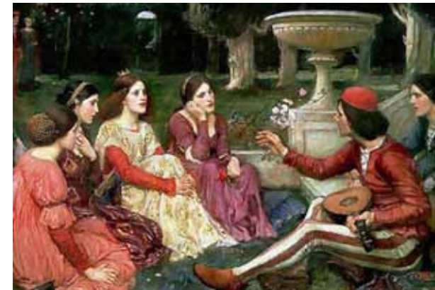
Vertellen door de jonge dames en de jongelingen...