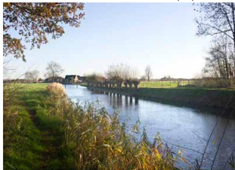
De Kromme Rijn bij Werkhoven

Zoals uit geschiedenis blijkt is er door de eeuwen heen altijd veel water geweest in het Kromme Rijngebied. Door het graven van het Amsterdam-Rijnkanaal, 1e helft 20e eeuw, kwam daar substantieel verandering in. Het kanaal loopt namelijk dwars door het Kromme Rijngebied en aangezien het peil van het