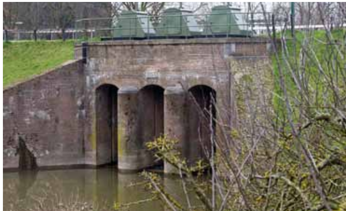
Inlaatsluis in de dijk bij Wijk bij Duurstede

In grote lijnen bleef deze situatie bestaan tot midden 19e eeuw. Toen ging de Kromme Rijn een rol spelen bij de ontwikkeling van de Nieuwe Hollandse Waterlinie. De rol van de Kromme Rijn had betrekking op het inunderen van diverse z.g. inundatiekammen van de waterlinie. Daar moesten overigens wel de nodige voorzieningen voor worden getroffen.