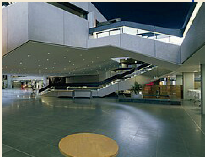
Groot, groter, grootst...