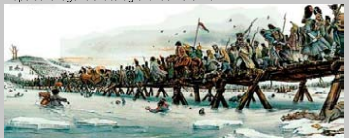
Napoleons leger trekt terug over de Berezina

Aanmelden: verhoeff@zonnet.nl of 030-2316330