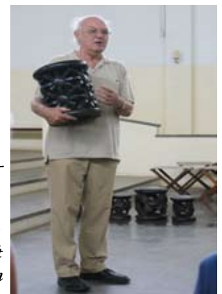
college in het Yaondé klooster

De kroon op uw werk in Afrika en uw werkzaamheden in Nederland – met andere woorden uw grote kennis van dit werelddeel, haar bevolking en kunst – wordt de voltooiing van uw proefschrift (in 2012) 'Objects with power in indigenous African religions'.>>>