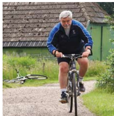
uitdagingen, vooral na je 50e...

Data: woensdagen 1 februari t/m 21 maart 2012 (7 bijeenk.) van 14-16 u op de Hogeschool Utrecht-Amersfoort te A'foort. Code 02M228