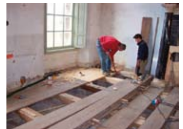
restauratie vloer grote zaal

En... wees er snel bij, want soms kunnen er, gezien de te bezoeken locatie, maar een beperkt aantal deelnemers mee. <