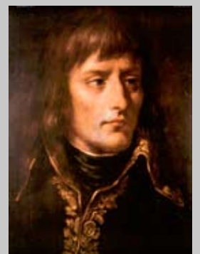
de jonge Corsicaan