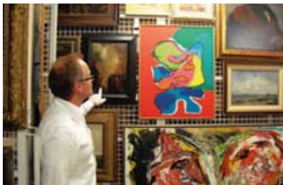
het depot van Het Nijenhuis