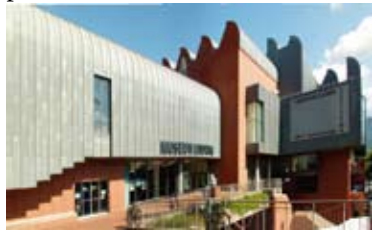
Museum Ludwig te Keulen

Vrienden ontvangen begin januari een uitnodiging per post/email met alle informatie.