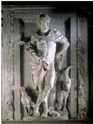
Mercurius door Artus Quellinus

De gouden Eeuw is een periode geweest waarin de Nederlandse economie tot grote bloei kwam, de handel met de ons omringende landen groeide, andere continenten werden ontdekt en de steden zich uitbreidden. Er woonden ongeveer 2 miljoen mensen in Nederland. Maar er waren grote verschillen tussen arm en rijk. Nederland als geheel werd rijk en machtig. De kunst en de wetenschap bloeiden op. Anthonie van Leeuwenhoek maakte de eerste microscoop en Jan Swammerdam onderzocht er insecten mee. Christiaan Huygens vond de eerste slingerklok uit. Hugo de Groot was een beroemd schrijver. De groeiende welvaart schiep veel werkgelegenheid. In de aangrenzende landen was dat anders en daardoor trokken velen weg uit de gebieden waar weinig of geen werk was naar de Republiek. Ook andersdenkenden die vervolgd werden vonden hun weg naar ons land; arbeidsmigratie is van alle tijden.