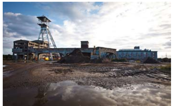
de mijngebouwen van Hasselt/Genk die Manifesta 9 zullen huisvesten

Lustrumprijs: 20,- euro p.p. Vriendendonateurs 2012 ontvangen in het voorjaar 2012 een uitnodiging per email/post.