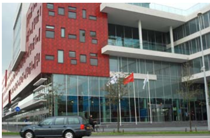
het gloednieuwe pand van HU-Amersfoort