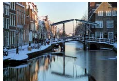
Oude Rijn, Leiden

Prof.dr. Maarten Prak zal op zijn eigen boeiende wijze de Gouden Eeuw voor ons doen leven en parallellen proberen te trekken naar de periode waarin wij leven. Een periode die ook gekenmerkt wordt door grote welvaart, (met een gemiddeld bruto jaarinkomen van 30900 euro staat Nederland na Luxemburg op de tweede plaats in de Eurozone), grote staatsschulden in de eurozone, veel arbeidsmigratie, en politieke en economische onevenwichtigheden in de eurozone. <