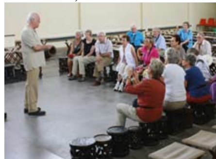
het Yaondé Benedictijnerklooster

huwelijksplannen werden gesmeed, er werd een huis gebouwd. In deze woning werd een beeld geplaatst, IKENGA genaamd. In de plaatselijke taal wil dat zeggen 'de kracht van de rechterhand'. Deze gestalte boezemde ontzag in: hij was naakt en viriel. Zijn gezicht was ruig; op het hoofd droeg hij ramshoorns. Het is de verbeelding van de idee dat het de rechterhand is die de man in staat stelt zijn ideeën te verwezenlijken. Het onthoofden van een medemens